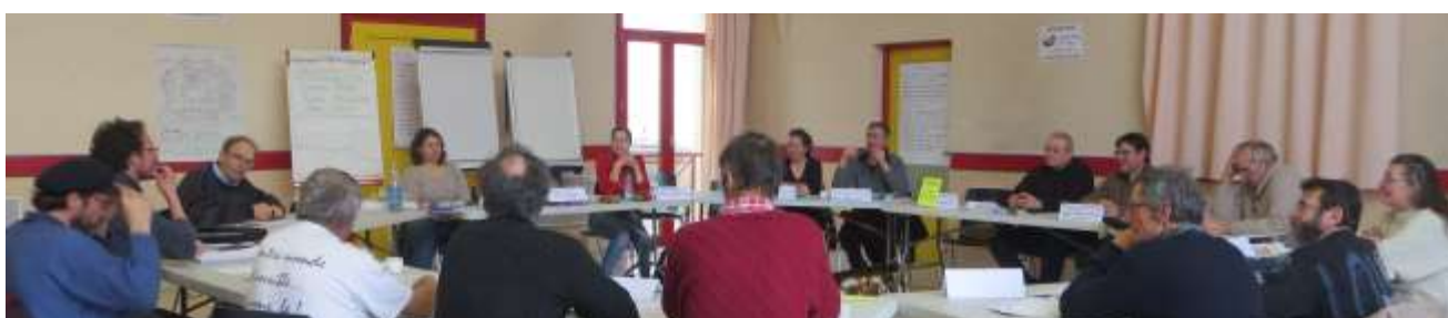
Le 3 mars à Atton