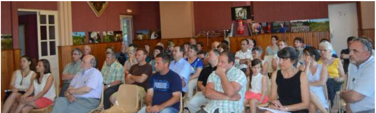
Le 23 juin à Montigny-le-Roi

L'ARDEAR travaille à la mise en place d'une gouvernance alimentaire en Haute-Marne. Ce projet en partenariat avec le PETR du Pays de Langres et la Chambre d'agriculture de Haute-Marne a été lancé sur la Communauté de communes du Bassigny. Les trois ateliers - organisés à Daillecourt, Rançonnières et Montigny-le-Roi - ont été un franc succès. 115 participants sont venus découvrir les différents modes de vente directe grâce aux témoignages de producteurs et consommateurs.