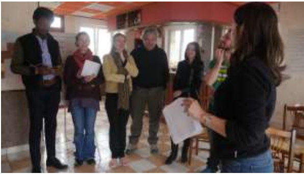
Le 12 avril à Le Chesnes

"Une formation pour prendre du recul" "Aujourd'hui, j'ai compris ce qu'il se passait dans la tête d'un client"