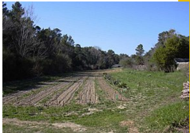
Le terrain de Guillaume en fin d'hiver

Dépendance aux dispositifs d'aides : Guillaume a fait les démarches pour bénéficier de la DJA (22 000€ qui ont été utilisés essentiellement pour vivre). Il a également eu droit au PACTE LR. Jusqu'à 2010, il a bénéficié du crédit d'impôt bio et de l'aide à la certification.