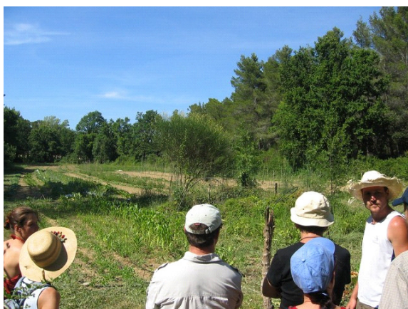
Le terrain de Guillaume lors d'une visite des adhérents de l'AMAP

Circuits de Vente : Guillaume fonctionne en AMAP depuis juillet 2008, et participe ponctuellement à des foires d'été.