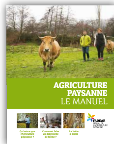
Le manuel de l'Agriculture paysanne