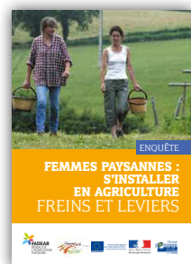
Femmes paysannes : s'installer en agriculture