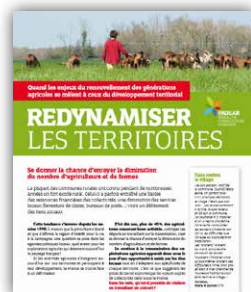
Redynamiser les territoires

Plus d'informations en écrivant à contact@fadear.org